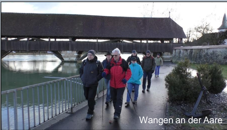
Wangen an der Aare

Um 09:35 sind wir in Wangen an der Aare eingetroffen. Nach der Begrüssung der beiden zuzüger haben wir den Weg durch das Dorf Richtung Aare unter die Füsse genommen. Der frühmorgendliche Regen hat sich zurückgezogen und die Sonne kommt bereits teilweise zum Vorschein.