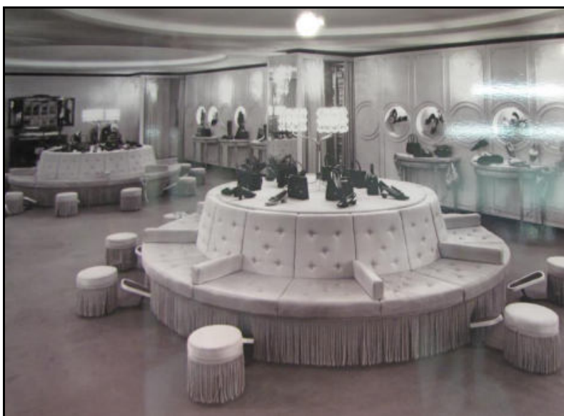
Ladeneinrichtung aus vergangenen Tagen