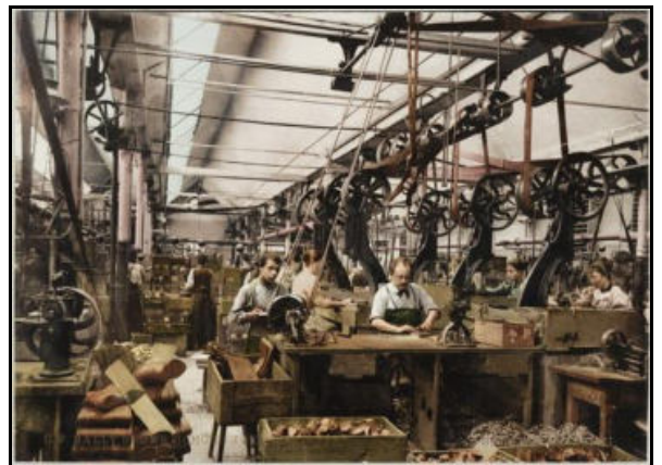
Schuhproduktion anno dazumal